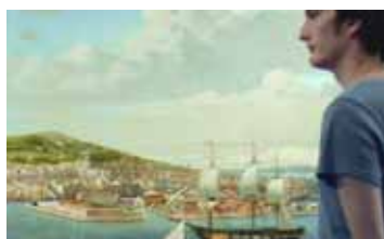
UN JEUNE POÈTE Un long court