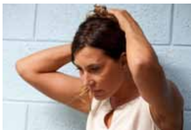
Avec mon p'tit bouquet de Stéphane Mercurio écrit pour ZAZIE